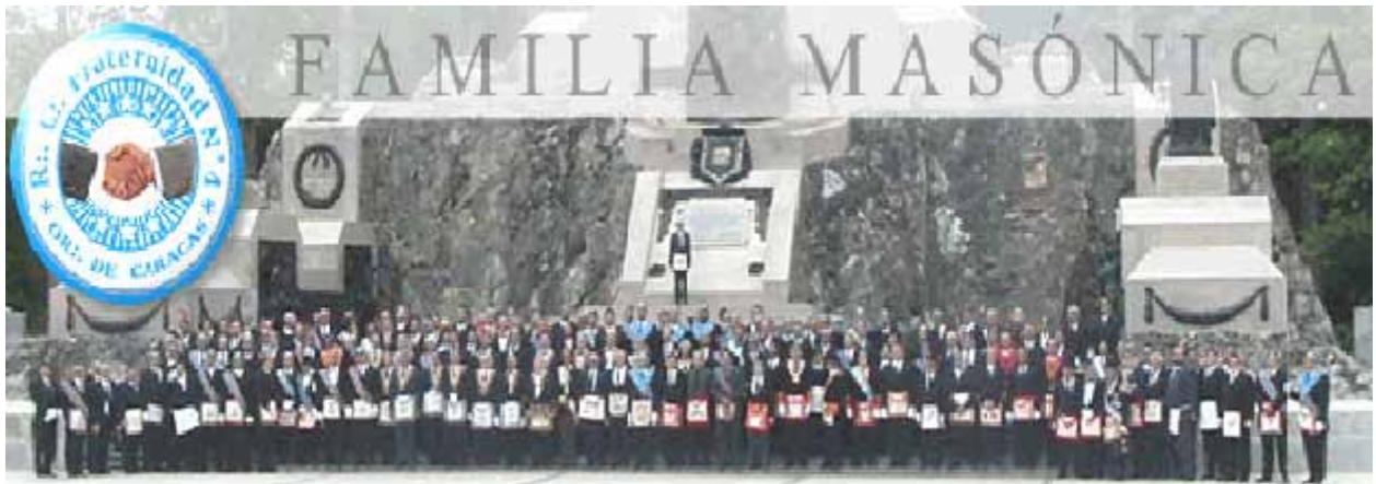
Este magnífico grabado nos da la pauta de la magnitud fraterna de la R.:L.:S.: «Fraternidad» N° 4, de Caracas - Venezuela - y el número de QQ.:HH.: que hacen su tarea en el taller.